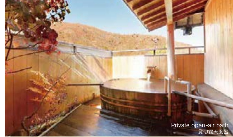
Private open-air bath 貸切露天風呂